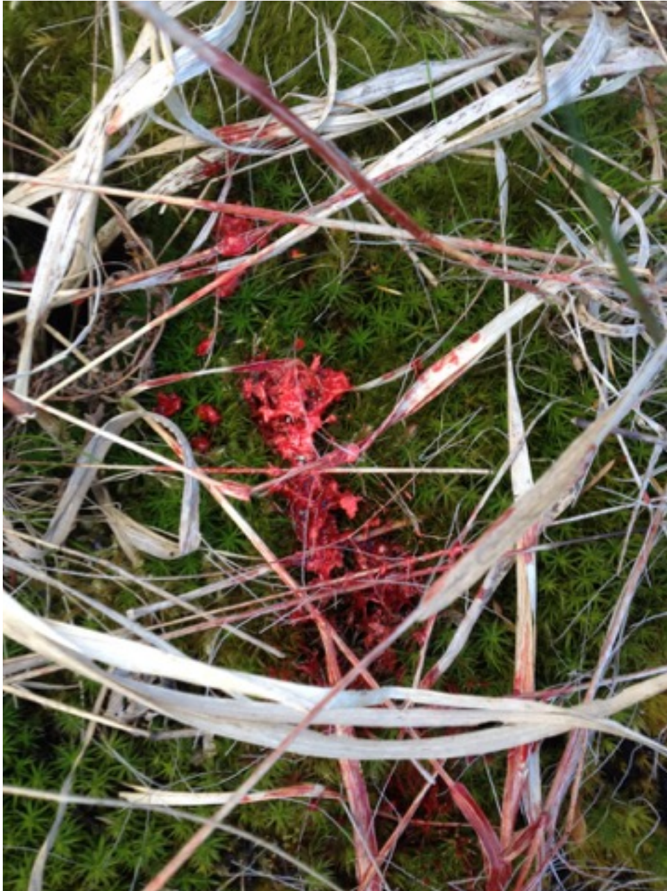
01 - Lungengewebe und reichlich Lungenschweiß am Anschuss

Am ersten Mai konnte ich gegen 19.00 einen Jährlingsbock von 12 kg mit 7627 MJG aus 300 WM erlegen. Das Stück hatte in 93 m Entfernung keinen Schimmer von meiner Anwesenheit. Es quittierte den reinen Lungenschuss mit deutlichem Zeichnen und Verenden am Anschuss nach wenigen Sekunden.