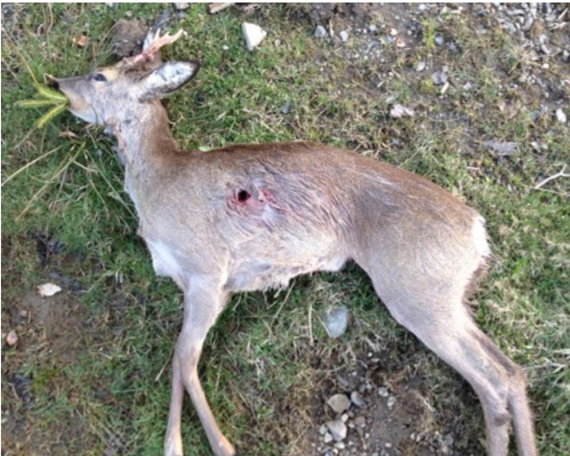
03 - Ausschuss