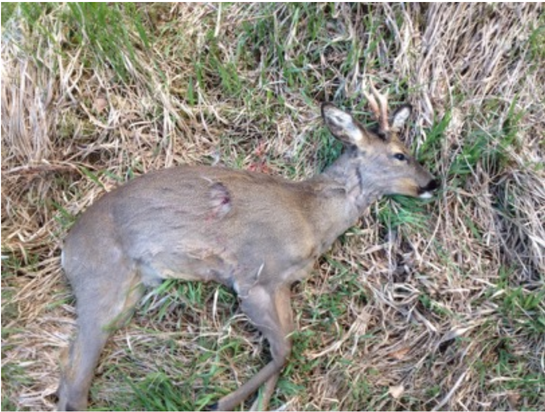
02 - Einschuss durch die Lunge hinterm Schulterblatt